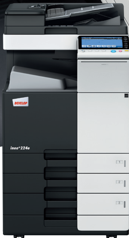
ineo+ 224e s podavačem papíru (PC-210) a duálním jednorůchodovým podavačem originálů (DF-701)