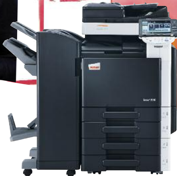
ineo+ 220 s podavačem originálů (DF-617), podlahovým finišeřem (FS-527), brožovacím modulem (SD-509) a s podstavným zásobníkem na 2x 500 listů (PC-207)