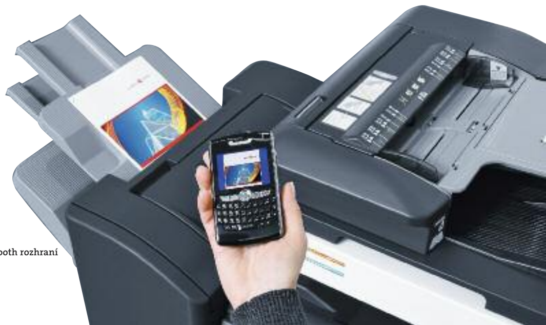
Tisk z mobilu pomocí přídavného Bluetooth rozhraní