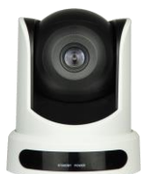
DISK STREAM SET